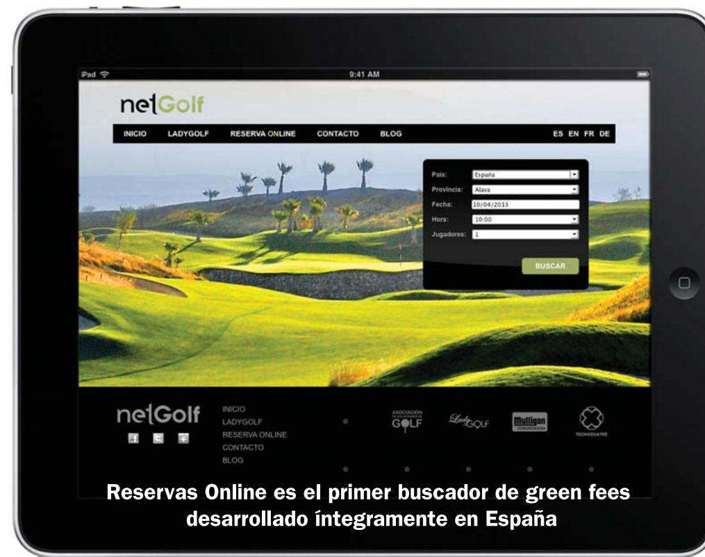
Reservas Online es el primer buscador de green fees desarrollado íntegramente en España

RESERVAS ONLINE es una aplicación desarrollada por Netgolf para la búsqueda y compra de green fees en todos los campos de España