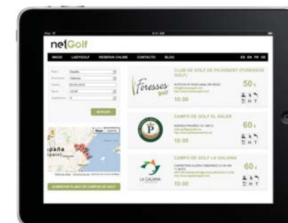
La aplicación muestra la mejor opción en precios de todos los campos de la provincia acorde al número de jugadores y el horario que se desee adquirir el green fee.